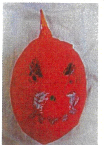
午後チームの写真は あしたにつく→